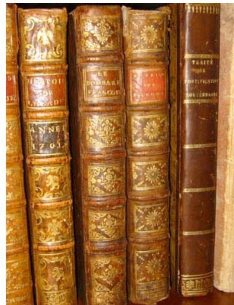
BELIDOR (Bernard Forest de) - Le Bombardier françois, ou nouvelle méthode de jeter les bombes avec précision.

Un artilleur français, Bernard Forest de Bélidor, va mettre la science au service de la guerre. sa démarche est scientifique et repose sur les mathématiques et lorsqu'il ne peut travailler sur la seule théorie, il a recours à l'expérience pour tenter d'en déduire